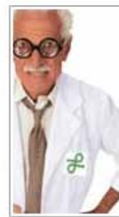
PRODOTTI PER RICERCA

L'alta qualità dei prodotti trattati e il continuo aggiornamento, oltre alla professionalità delle risorse umane coinvolte nelle varie divisioni, fanno della Prodotti Gianni, un'azienda leader nel settore in cui opera.